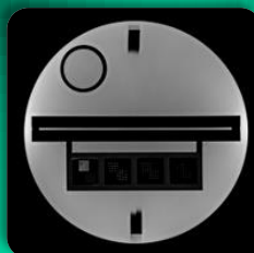
اسلایس ۱ رزولوشن، ضخامت اسلایس