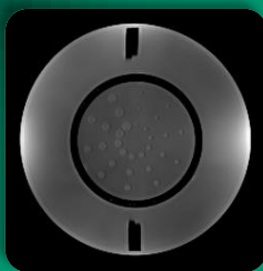
اسلایس ۱۱ آشکارسازی کنتراست پایین، موقعیت اسلایس